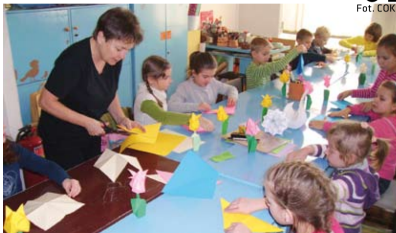
Czary z papieru - warsztaty origami