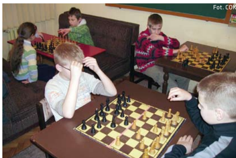
Ferie z szachami