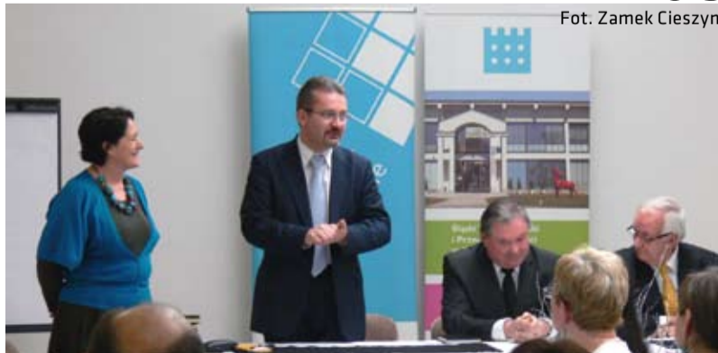
Przedstawiciele gminy i powiatu cieszyńskiego spotkali się z reprezentantami lokalnych przedsiębiorstw