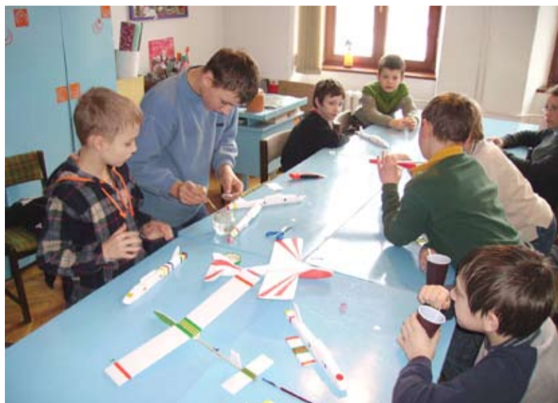
Warsztaty modelarstwa lotniczego